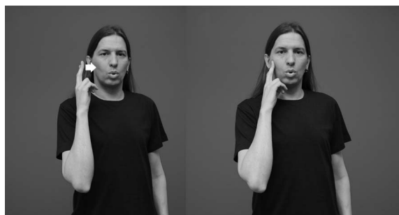
Bildserie 2. Tecknet DÖV 2 .

Tecknet har uppenbarligen sina historiska rötter i det gamla tvådelade tecknet DÖVSTUM som tecknas på samma sätt som ovan men med hela handen. Numera har tecknets innebörd i vissa sammanhang avgränsats till en döv som hör till teckenspråksgemenskapen och har tillägnat sig dess kultur och identitet. 19 Detta stärker uppfattningen att teckenspråket snarare än avsaknaden av hörsel för teckenspråkiga själva är den viktigaste egenskapen som förenar medlemmarna i dövsamhället. I engelskspråkig litteratur uttrycks samma innebörd genom att man skriver ordet Deaf med versal initial. På finska och svenska kan motsvarande åtskillnad inte uttryckas med initialen, eftersom rättskrivningsreglerna för initialer är annorlunda än i engelskan; ord som betecknar gruppstillhörighet skrivs inte med versal initial i finska och svenska. I Finland används också tecknet DÖV 2 (bildserie 2).