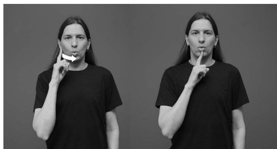
Bildserie 1. Tecknet DÖV 1 .

Tecknet har uppenbarligen sina historiska rötter i det gamla tvådelade tecknet DÖVSTUM som tecknas på samma sätt som ovan men med hela handen. Numera har tecknets innebörd i vissa sammanhang avgränsats till en döv som hör till teckenspråksgemenskapen och har tillägnat sig dess kultur och identitet. 19 Detta stärker uppfattningen att teckenspråket snarare än avsaknaden av hörsel för teckenspråkiga själva är den viktigaste egenskapen som förenar medlemmarna i dövsamhället. I engelskspråkig litteratur uttrycks samma innebörd genom att man skriver ordet Deaf med versal initial. På finska och svenska kan motsvarande åtskillnad inte uttryckas med initialen, eftersom rättskrivningsreglerna för initialer är annorlunda än i engelskan; ord som betecknar gruppstillhörighet skrivs inte med versal initial i finska och svenska. I Finland används också tecknet DÖV 2 (bildserie 2).