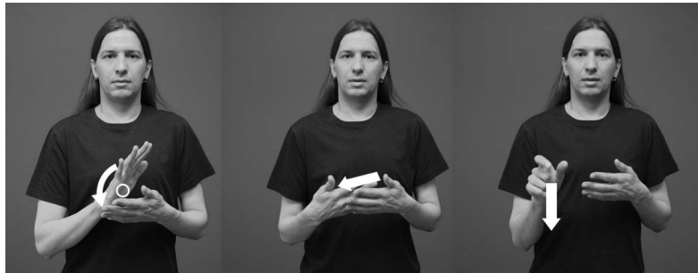
Bildserie 3. Tecknet TECKENSPRÅKIG på finskt teckenspråk.

Termen teckenspråkig (finska viittomakielinen ; i bildserie 3 tecknet TECKENSPRÅKIG) togs i bruk först efter en lagreform i slutet av 1990-talet. Termen har ännu inte etablerats inom dövsamhället. Teckenspråksutskottet vid Finlands Dövas Förbund definierade år 1999 teckenspråkiga på följande sätt: "personer som har lärt sig teckenspråk som sitt första språk, som behärskar teckenspråk bäst och som använder det i sitt dagliga liv kallar sig teckenspråkiga". I vardagligt bruk inom teckenspråksgemenskapen är termerna teckenspråksanvändare och teckenspråkig delvis överlappande. Innebörden hos termen teckenspråkig har dock utvidgats under de senaste åren: även hörande barn som föds i teckenspråkiga familjer kan ha teckenspråk som modersmål. Sådana personer avses däremot inte med uttrycket de som använder teckenspråk , som nämns i 17 § i grundlagen. Hittills har lagen tolkats så att dessa personer inte har rätt till de tjänster som är avsedda för teckenspråkiga döva (exempelvis tolkningstjänst).