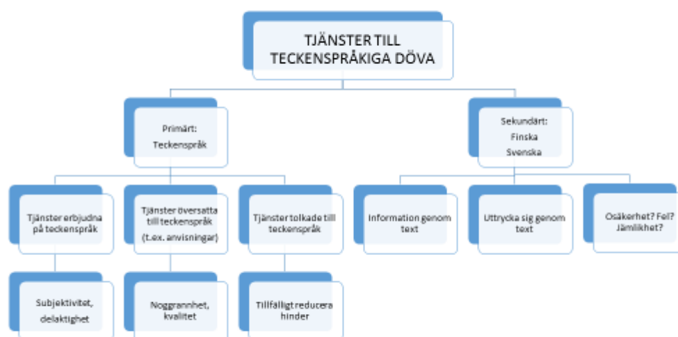
Figur 1. Tjänster till teckenspråksanvändande döva

Tjänster som sköts genom tolkning är i realiteten inte att tillgodose en språklig rättighet, eftersom det inte helt motsvarar en tjänst som produceras på teckenspråk. En teckenspråkig tolk översätter på samma gång tal till teckenspråk och teckenspråk till tal, och möjligheten att förbereda allt som behövs är begränsad. Misstag kan ske lätt, och delar av innehållet kan råka falla bort. Teckenspråkstolkning är en av de serviceformer som i Finland beviljas på grund av ett handikapp. Det fungerar bra som så kallad rimlig anpassning, en åtgärd som tillfälligt motverkar hinder för medverkan och ökar brukarens jämlikhet i servicesituationer, utbildning o.s.v.